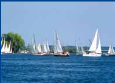
Hervorragende Freizeitmöglichkeiten in der Region