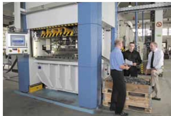
Begutachtung von Getriebeteilen am Stanzautomat EBU STA 320 der Ahlberg Metalltechnik GmbH in Berlin-Reinickendorf