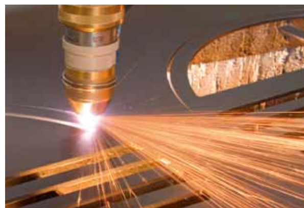
Kjellberg Finsterwalde Elektroden und Maschinen GmbH entwickelte die Technologie des HiFocus-Plasmaschneiders in Finsterwalde

Berlin-Brandenburg bietet eine breite Innovationslandschaft und die höchste Forschungsdichte Europas. Nahezu 72.000 Studierende sind in mathematisch-naturwissenschaftlichen Studiengängen eingeschrieben. Die deutsche Hauptstadtregion verfügt über namhafte national und international vernetzte Forschungs- und Entwicklungseinrichtungen, die sich beispielsweise in den Bereichen Entwicklung neuer Werkstoffe, erneuerbare Energien und innovative Bearbeitungstechnologien engagieren. An der Technischen Universität Berlin bietet seit 2011 das FORUM Forschungs- und Anwenderzentrum für Füge- und Beschichtungstechnik Firmen die Möglichkeit, neue technologische Lösungen zu entwickeln. Effiziente Netzwerke, vielfältige Kooperationsmöglichkeiten und ein innovationsfreundliches Klima machen die Region Berlin und Brandenburg zu einem führenden Wissenschafts- und Forschungsstandort, von dem Investoren in jeder Hinsicht profitieren.