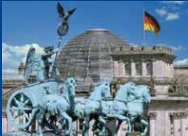
Quadrige vor der Reichstagskuppel