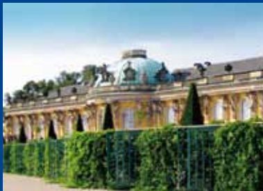
Schloss Sanssouci in Potsdam