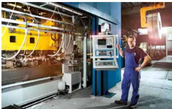
Kabelrinnenanlage der PUK-WERKE KG in Berlin-Neukölln

Traditionell ist die Stahl- und Metallindustrie eine der Schlüsselbranchen Deutschlands. Auch in der Hauptstadtregion ist die Branche einer der beschäftigungsreichsten und umsatzstärksten Industriezweige. Mehr als 52.000 Arbeitnehmer erwirtschaften hier in mehr als 400 Unternehmen einen Jahresumsatz von ca. 9,5 Mrd. Euro. Die Schwerpunkte der überwiegend mit-