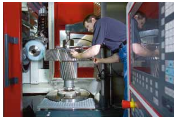
Endbearbeitung von Zahnrädern für Windradgetriebe auf modernsten Zahnflankenschleifmaschinen, Zahnradwerk Pritzwalk GmbH in Pritzwalk

Zwei eng miteinander kooperierende Unternehmensnetzwerke repräsentieren exzellente Plattformen für erfolgreiches Networking. profil-metall und M+E-Netzwerk bündeln die Branchenkompetenz der Region, fördern Kooperationen zwischen Unternehmen, Forschungseinrichtungen und Interessengruppen, engagieren sich für die Erweiterung des Marktzugangs und für eine Intensivierung der Marktkommunikation und betreiben Lobby-Arbeit. Die Beseitigung von Marktzugangsbarrieren, die Etablierung von Zuliefer- und Wertschöpfungsketten sowie die Entwicklung erfolgreicher Strategien zur Fachkräftesicherung stehen im Zentrum der Netzwerkaktivitäten. Investoren erhalten zudem vielfältige Unterstützung bei der Ansiedlung ihrer Unternehmen.