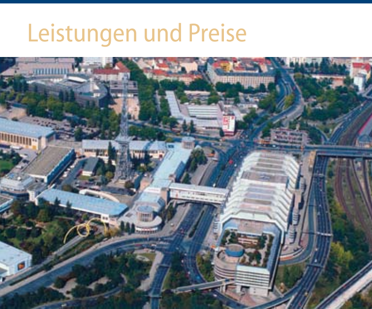
ICC Internationales Congress Centrum und Messe Berlin