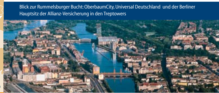
Blick zur Rummelsburger Bucht: OberbaumCity, Universal Deutschland und der Berliner Hauptsitz der Allianz-Versicherung in den Treptowern