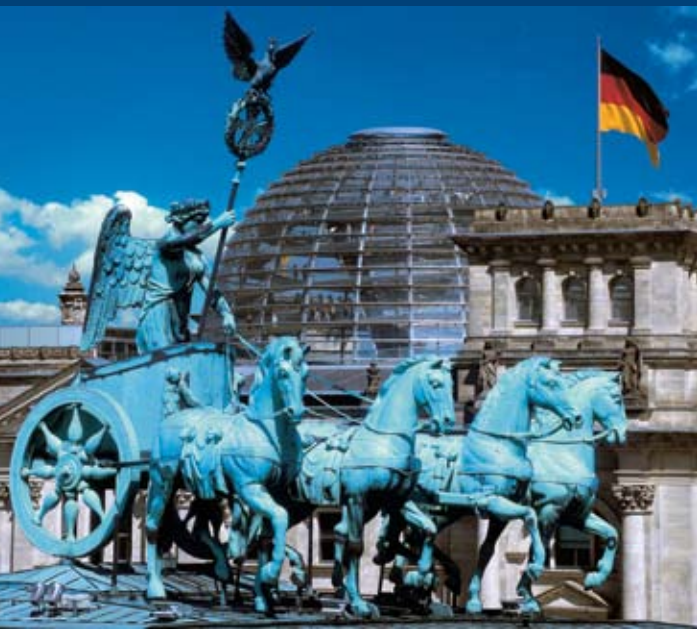
Quadriga auf dem Brandenburger Tor und Kuppel des Reichstagsgebäudes