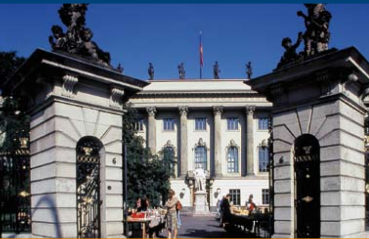
Humboldt Universität zu Berlin

Gewerbeflächen und Wohnraum Seit 1990 sind in Berlin rund 200 Milliarden Euro für private und öffentliche Bauinvestitionen ausgegeben worden. Dadurch hat sich das Angebot an preiswerten Wohn- und Gewerbe-Immobilien und Büroflächen erhöht. Vom renovierten Innenstadtquartier bis zur Villa am Wasser – attraktive Wohnlagen und günstige Preise kennzeichnen den Wohnungsmarkt in der Region. In zentralen Lagen der Stadt sind Miet- und Kaufpreise bedeutend niedriger als in Hamburg, München oder Frankfurt/Main. www.businesslocationcenter.de > Immobilienportal www.berlin-partner.de/locatingpackage