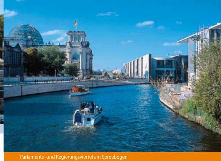
Parlaments- und Regierungsviertel am Spreebogen