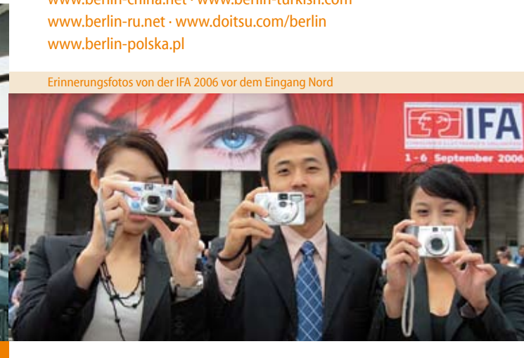
Erinnerungsfotos von der IFA 2006 vor dem Eingang Nord