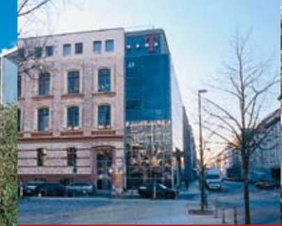
Hauptstadt-Repräsentanz Deutsche Telekom AG