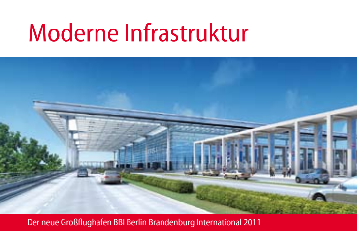
Der neue Großflughafen BBI Berlin Brandenburg International 2011