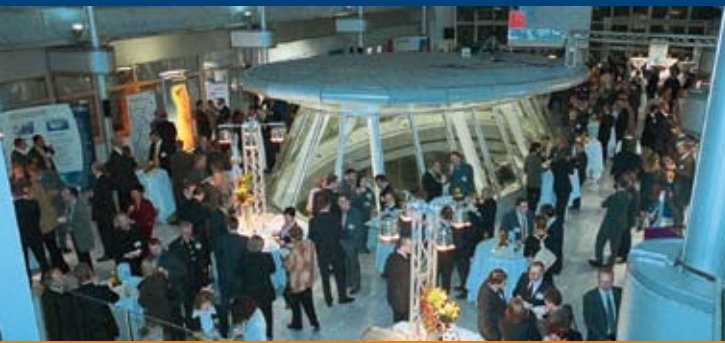
Ludwig Erhard Haus: Sitz der Berlin Partner GmbH, der Industrie- und Handelskammer sowie der Berliner Börse

Standorte Die Stadt bietet wissenschafts- und kommunikationsintensiven sowie technologieorientierten Unternehmen Standortbedingungen zu günstigen Preisen wie in keiner anderen deutschen Region. Sechs Technologieparks, darunter die renommierten Standorte Adlershof und Buch, 20 Gründerzentren sowie 70 außeruniversitäre Forschungseinrichtungen stehen für das attraktive Angebot. www.berlin.de/sen/wirtschaft/branchen/tzgz.html