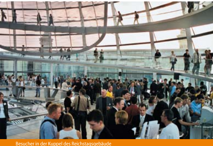
Besucher in der Kuppel des Reichstagsgebäude