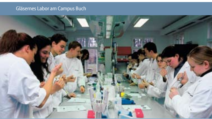
Gläsernes Labor am Campus Buch

Human Capital Die Arbeitnehmer in Berlin und Brandenburg sind hervorragend ausgebildet, motiviert, flexibel und international wettbewerbsfähig. Investoren treffen nahezu in jeder Branche auf einen entspannten Arbeitsmarkt. Dabei liegen die Personalkosten um 10 bis 20 Prozent niedriger im Vergleich zu anderen deutschen Großstädten. An den vier Berliner Universitäten, drei Kunsthochschulen, acht Fachhochschulen sowie zehn privaten Hochschulen gibt es 131.000 Studierende. Rund 42.300 junge Menschen studieren derzeit an den drei Universitäten und elf Hoch- und Fachhochschulen in Brandenburg. Praxisnahe Weiterbildungs- und Berufsausbildungsprogramme der Industrie- und Handelskammer sowie zahlreicher Bildungsträger garantieren ein hohes Qualifizierungsniveau der Mitarbeiter. www.berlin-sciences.com www.berlin-partner.de/recruitingpackage