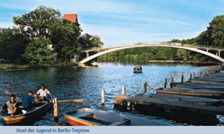
Insel der Jugend in Berlin-Treptow

Lebenswerte Stadt Die Lebensqualität in Berlin ist für Entscheider ein wichtiges Argument, sich hier anzusiedeln. Berlin ist trotz seiner Größe eine grüne Metropole: 30 Prozent der Stadtfläche sind Wälder, Parks, Seen, Flüsse und Kanäle. Die Nähe zu den brandenburgischen Seen und Wäldern sowie zur Ostsee erweitern das Freizeitangebot der Berliner. Darüber hinaus bietet Berlin eine Vielzahl von Einkaufsmöglichkeiten: Die Stadt hat nicht nur die meisten Kauf- und Warenhäuser, sondern auch die meisten Shopping-Center in Deutschland. Über 60 Einzelhandelsstandorte, darunter das bekannte „Kaufhaus des Westens“ (KaDeWe), bieten oft Einzigartiges. Über 7.000 Restaurants, Bars, Kneipen, Diskotheken und Cafés in allen Preislagen laden zum Verweilen ein.