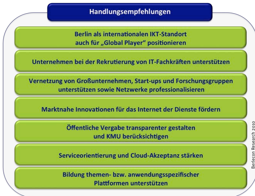
Abb. 3 Handlungsempfehlungen im Einzelnen

Die Autoren der Studie leiten folgende konkrete, branchenübergreifende Handlungsempfehlungen für die Berliner Politik ab: